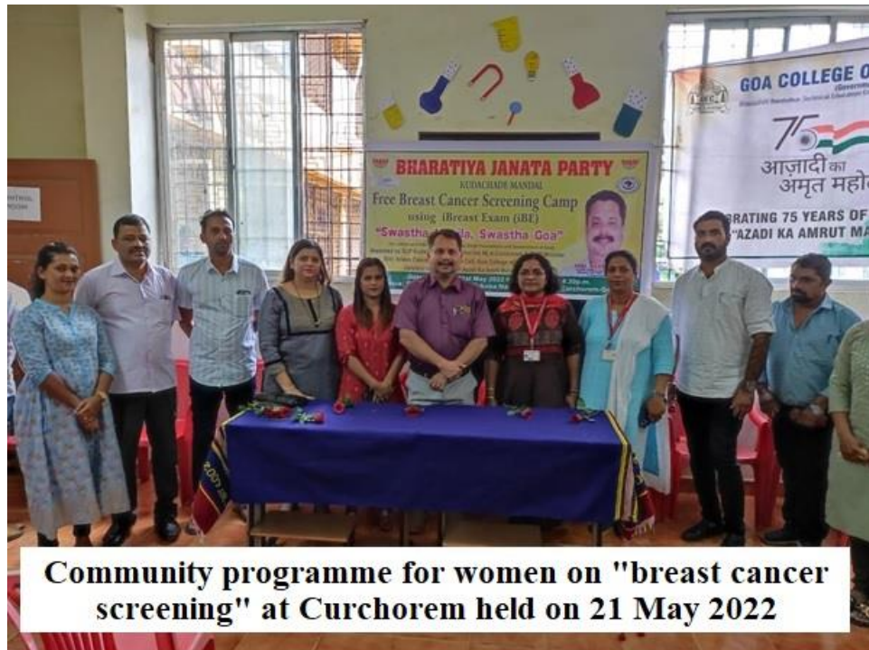
Community programme for women on "breast cancer screening" at Curchorem held on 21 May 2022